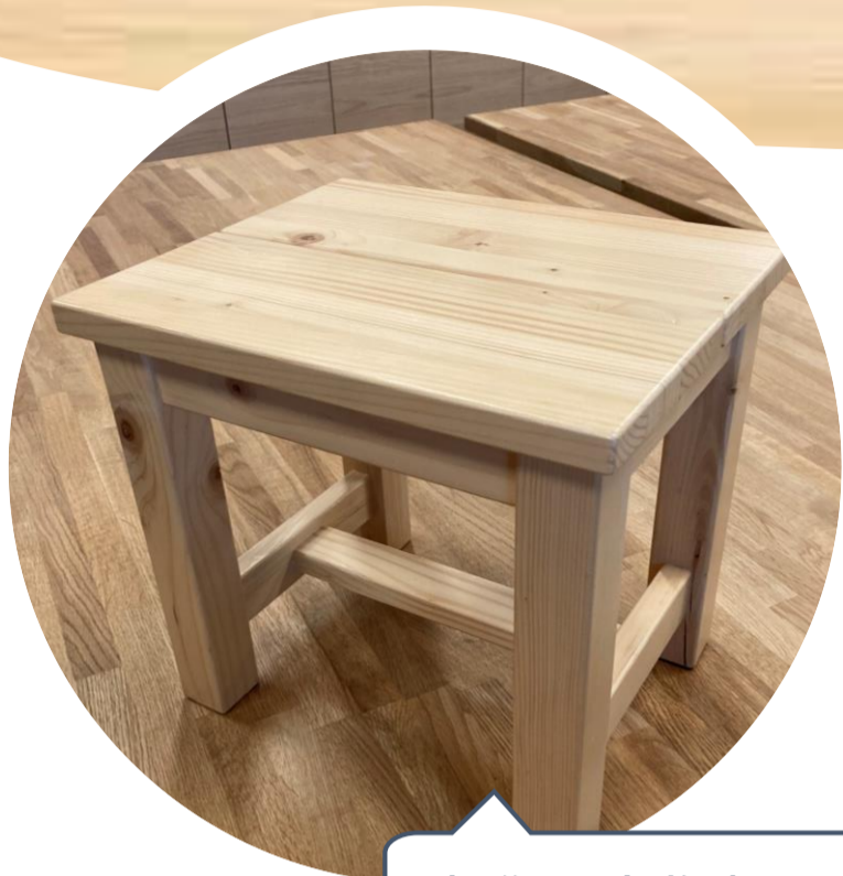
制作予定物(スツール)